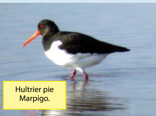
Huitrier pie Marpigo.