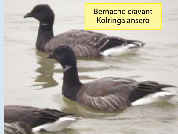
Bernache cravant Kolringa ansero