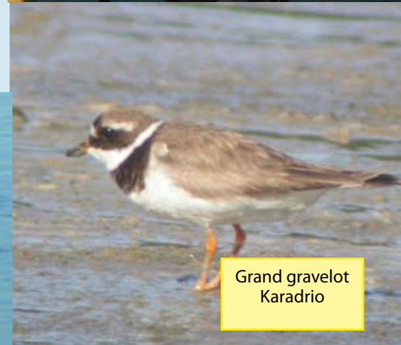
Grand gravelot Karadrio