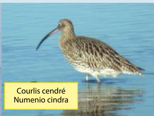
Courlis cendré Numenio cindra