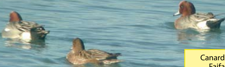
Canard siffleur Fajfanaso