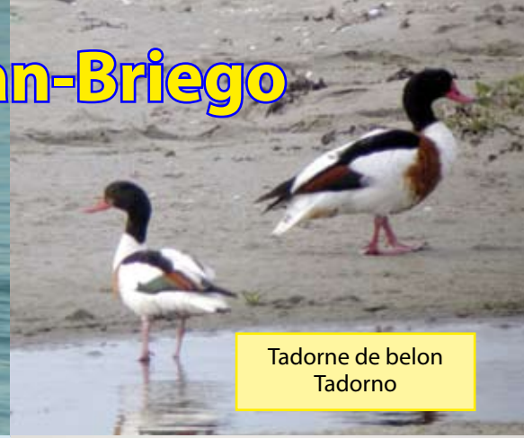
Tadorne de belon Tadorno

La produktiva riĉeco kaj diverseco de la medio estas atestita de la ĉeesto de birdfaŭno. Laŭ la kvanto kaj laŭ la diverseco de birdoj la sanbriega golfeto unuarangas. Ornitologie, la fundo de la golfeto de San-Briego situanta sur akso de manik- atlantika migrado estas agnoskita kiel vasta strando kun internacia intereso.