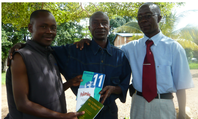
BI ANEB Sud Kivu (2011)

Venas al mi abundaj monpetoj. Mi devas klarigi kaj rifuzi. Komprenable mi estas riĉa kompare kun ili. Sed la prezoj en Svislando estas tre altaj ; ni devas konsideri la diferencon inter enspezoj kaj elspezoj ; tie vidiĝas riĉeco aŭ ne. Mi neniam posedis domon. En Svislando mi luas apartamenton. Afrikanoj ne povas kredi tion. « Vi estis instruisto ! Do tutcerte vi posedas vian domon ! » Ne. Multaj afrikaj esperantistoj estas solidaraj kaj akceptas georfojn, edukas genevojn, helpas en sia vilaĝo. Kelkaj inventas prizorgadon de georfoj kaj petas monon al ni Norduloj. Multaj okcidentaj esperantistoj subtenas afrikanojn. Multaj okcidentaj esperantistoj plendas pri tiuj eternaj monpetoj. Mi neniam donas monon. Mi alportas librojn, gazetojn en Eo. Mi repagas vojaĝon, rekompensas laboron, kontribuas al konkretiĝanta agado. Mi organizas kursojn en Kotonuo kun lertigado de virinoj en gvidaj roloj, enkonduko en la skribado kaj legado de la fonua lingvo, la loka lingvo, kaj instruado de Eo. Tiuj kursoj por universitatnivelaĵ virinoj inter 18 kaj 30-jaraj estas granda sukceso. Mi provas