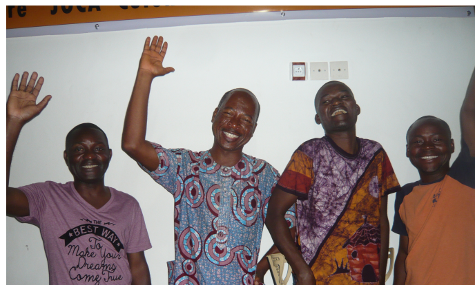
AKE 4 membroj de AK (2013)